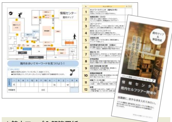
▲館内マップ&解答用紙